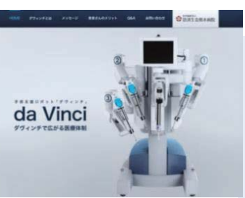
▲ da Vinci 特設サイト